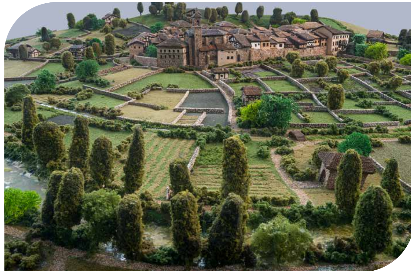
"Villafranca 1700 urte inguruan" maketa, D'elikatuz Zentroan ikus daiteke | Maqueta "Villafranca hacia el año 1700", se puede visitar en D'elikatuz Zentroa

Los pueblos de la zona solicitaron la unión con Villafranca para protegerse de los peligros y disfrutar de los privilegios de la villa, unión que perduró hasta el año 1615.