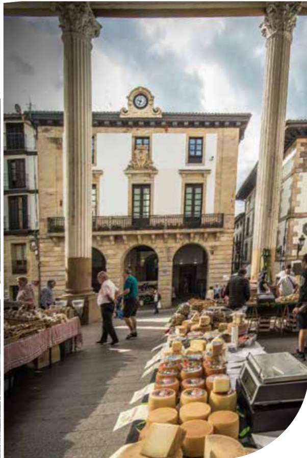
Ordiziako azoka, atzo eta gaur | Mercado de Ordizia, ayer y hoy