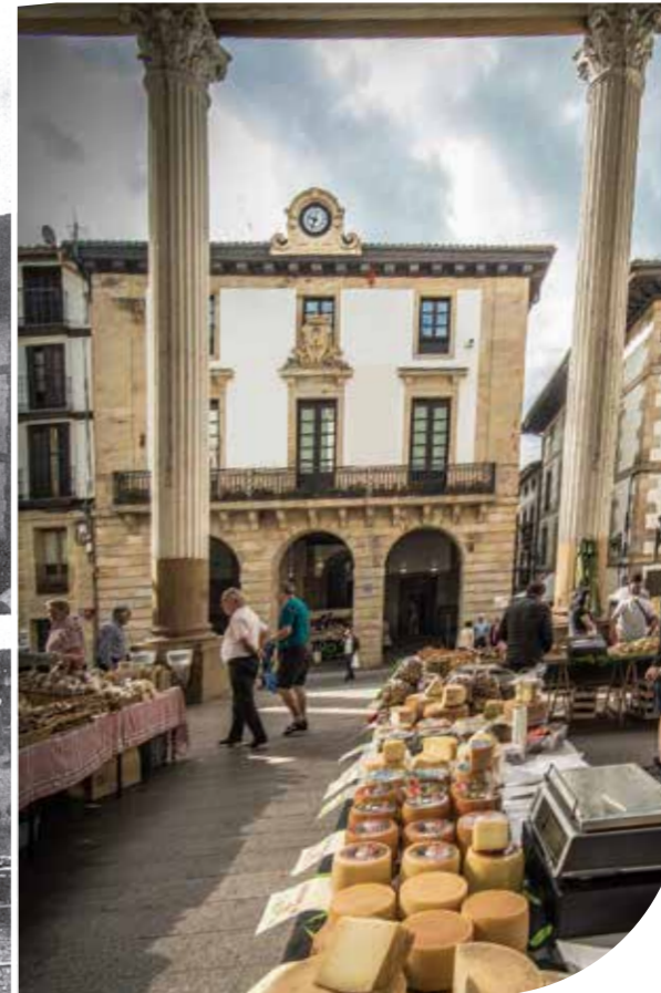
Ordiziako azoka, atzo eta gaur | Ordizia Market, yesteryear and now