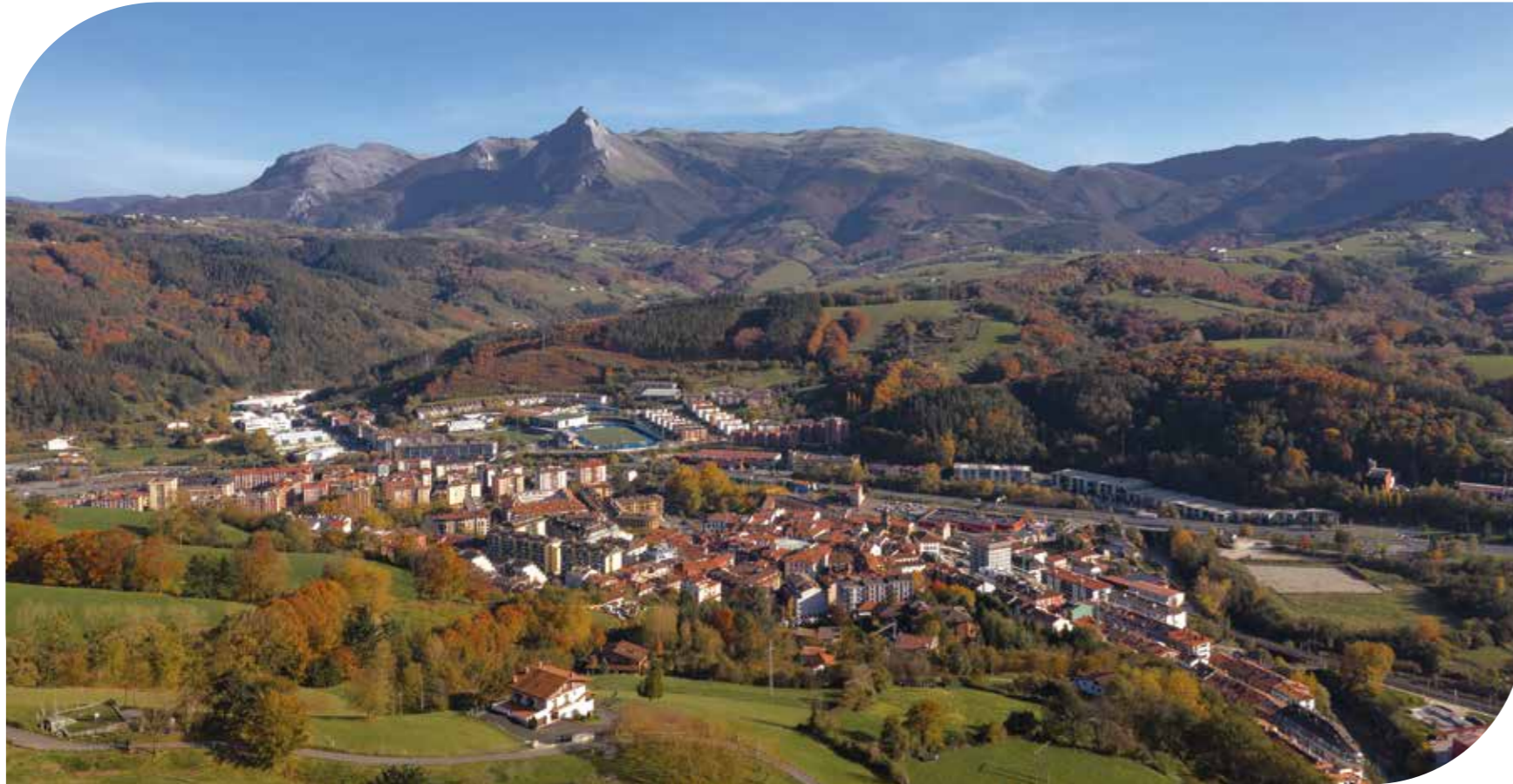
Ordizia, Txindoki mendia atzean duela | Ordizia, with mount Txindoki in the background