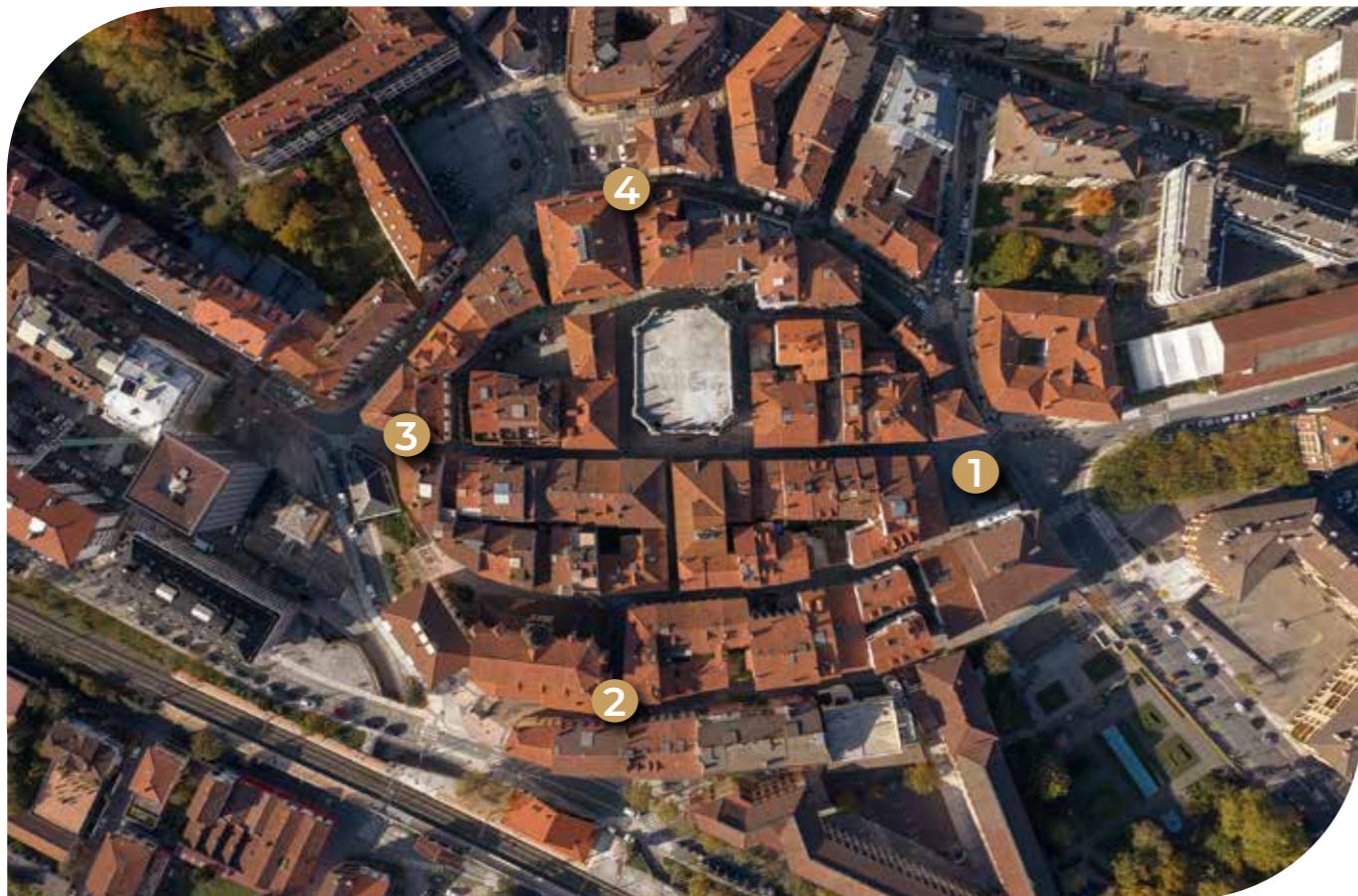
Elipse edo almendra formako kasko historikoaren airtiko ikuspegia | Aerial view of the almond or elliptic-shaped historic centre