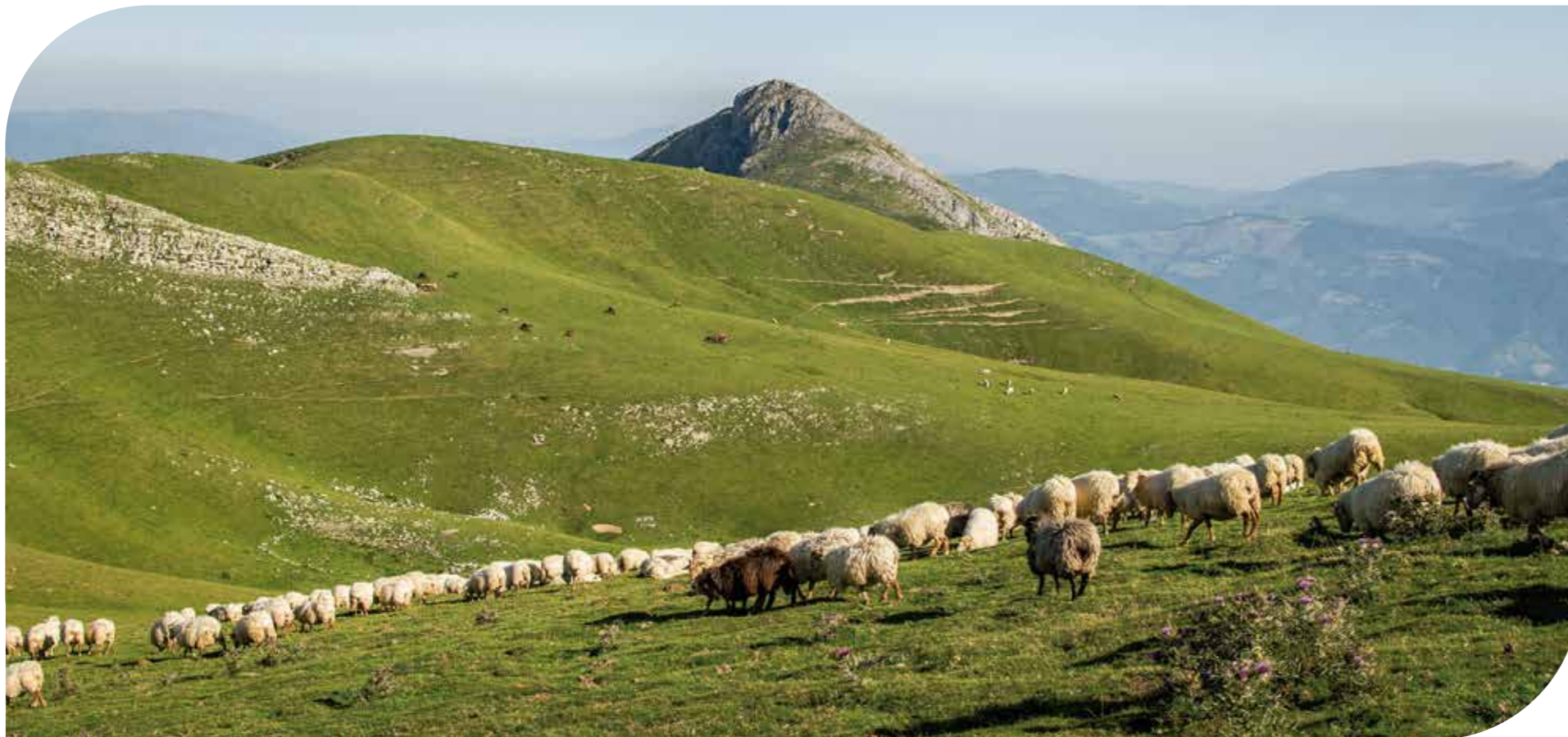
Aralarko Natura Parkea | Aralar Natural Park