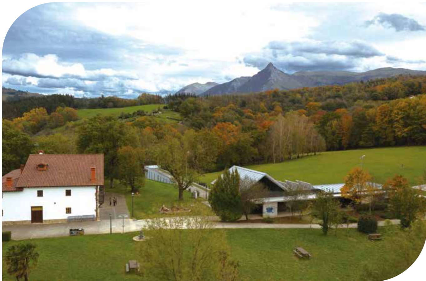
Oiangu parkea | Oiangu Park