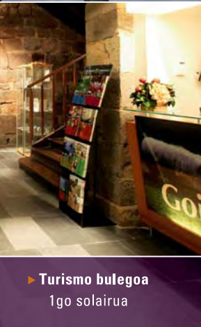
► Turismo bulegoa 1go solairua