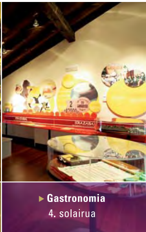
► Gastronomia 4. solairua