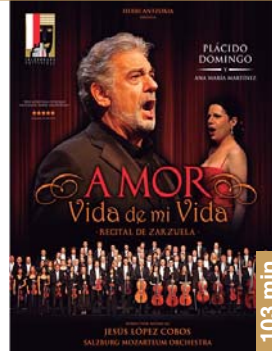
Amor vida de mi vida ostirala 26 → 22:15 Plácido Domingo y Ana María Martínez