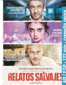
Relatos salvajes ostirala 12 → 22:15 larunbata 13 → 22:15 igandea 14 → 19:30-22:15 astelehena 15 → 19:30