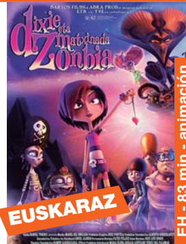
Dixie eta matxinada zontzia igandea 14 → 16:45