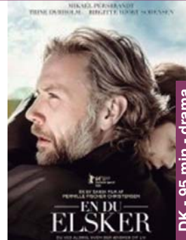
Alguien a quien amar asteazkena 17 → 20:30 V.O.S.