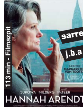
Hannah Arendt ostirala 5 → 22:15 Alemán, inglés, francés, hebreo