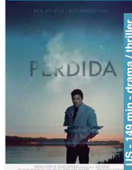
Perdida larunbata 6 → 19:30-22:15 igandea 7 → 19:30-22:15 astelehena 8 → 19:30