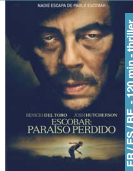
Escobar: Paraíso perdido ostirala 19 → 22:15 larunbata 20 → 19:30-22:15 igandea 21 → 19:30-22:15 astelehena 22 → 19:30