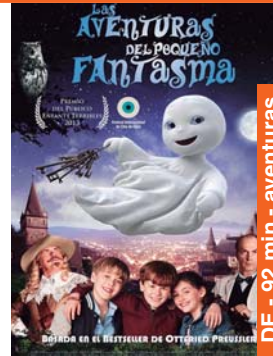
Las aventuras del pequeño fantasma igandea 21 → 16:45