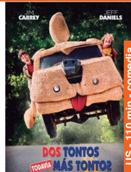
Dos tontos todavía más tontos igandea 28 → 16:45