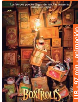
Los Boxtrolls igandea 7 → 16:45