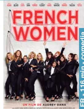
French women larunbata 27 → 19:30-22:15 igandea 28 → 19:30-22:15 astelehena 29 → 19:30