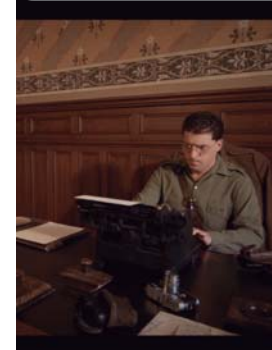
Uda minean negua larunbata 13 → 18:00 Dokumentalaren proiektzioa eta ekitaldia