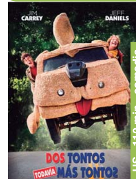
Dos tontos todavía más tontos osteguna 1 → 19:30