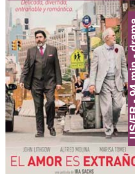
El amor es extraño asteazkena 10 → 20:30 V.O.S.