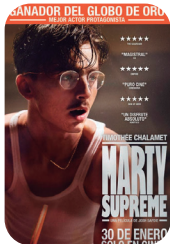
Marty supreme larunbata 31 ▶ 19:30-22:00 igandea 1 ▶ 19:30 astelehena 2 ▶ 19:30 149 min - USA + 16 urte estreinaldia