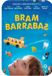
Bram Barrabaz igandea 8 ▶ 16:45 80 min - NL - T.P. zinema euskaraz