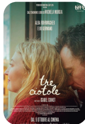
Tres adioses larunbata 7 ▶ 19:30-22:00 igandea 8 ▶ 19:30 astelehena 9 ▶ 19:30 asteartea 10 ▶ 19:30 120 min - IT estreinaldia