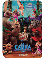
Goat, como cabras igandea 22 ▶ 16:45 100 min - USA - T.P.