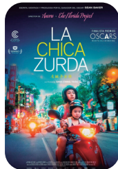
La chica zurda larunbata 14 ▶ 19:30-22:00 igandea 15 ▶ 19:30 astelehena 16 ▶ 19:30 asteartea 17 ▶ 19:30 108 min - TAI - + 12 urte