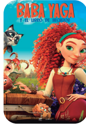
Baba Yaga igandea 15 ▶ 16:45 101 min - RUS - T.P.