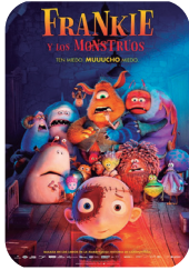
Frankie y los monstruos igandea 1 ▶ 16:45 91 min - AL - T.P.