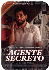
El agente secreto larunbata 21 ▶ 19:30 igandea 22 ▶ 19:30 astelehena 23 ▶ 19:30 asteartea 24 ▶ 19:30 158 min - BRA - + 16 urte estreinaldia