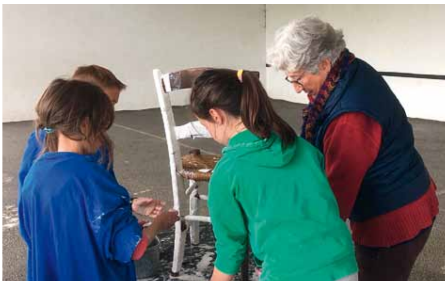
Oztibarreko ikastolako haurrekin lanean / Trabajando con los niños de Oztibarreko ikastola Travaillant avec les enfants de l'ikastola de l'Oztibarre